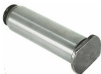
Pino Rolete Patim Freio Ar Traseiro 19x70mm (Sapatinha)