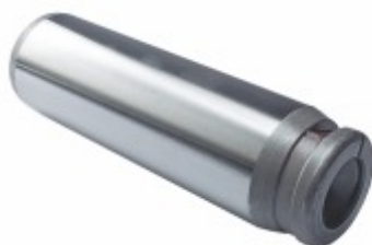
Pino Sapata (30x102mm) c/ Chanfro Original c/ Tratam.