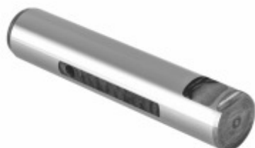
Pino Mola Com Fresa (25x140mm)