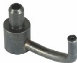
Bico Injetor de Óleo 8

Cód. Bradipar MB.10.0007.4 Cód. Original 460.180.03.43