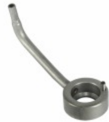
Bico Injetor de Óleo 3

Cód. Bradipar MB.10.0009.4 Cód. Original 352.180.01.43