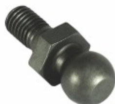
Pino Esférico Freio Motor