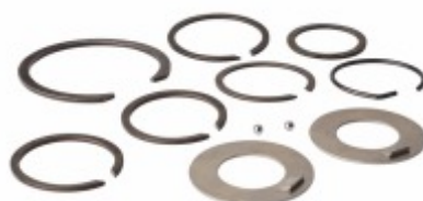
Kit Trava Caixa Câmbio EATON 240 260FFORDGM