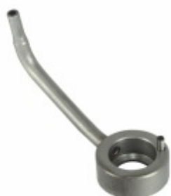
Bico Injetor de Óleo 12