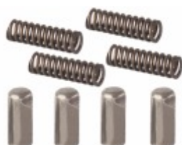
Kit Pino Interruptor Posição Neutra 1620/1622 1218/1725/1417/1418 1722/518/G