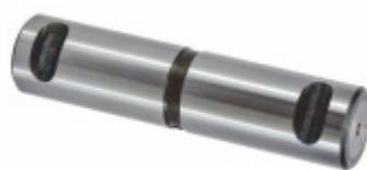
Pino da Balança 50 x 215 mm Chaveta Cônica