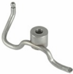
Bico Injetor de Óleo 1

Cód. Bradipar MB.10.0001.4 Cód. Original 427.180.00.43