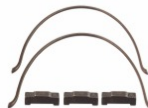
Kit Lamela Anel Sincronizado 3, 4 e 5 FSO4305