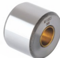
Rolete com Bucha de Bronze Diam Interno Ø 23mm