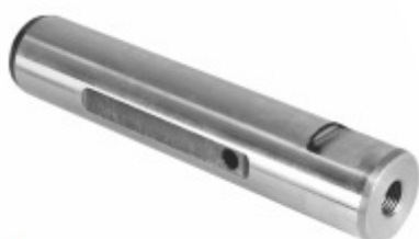
Pino Mola Sem Fresa (25x117mm)