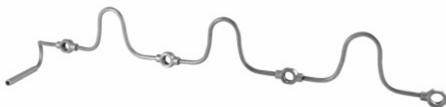
Cano Retorno Óleo Cabeçote