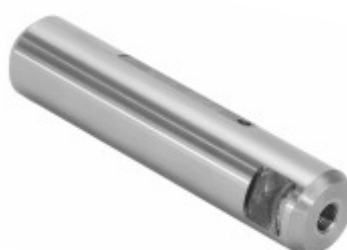
Pino Mola Sem Fresa (30x136mm)