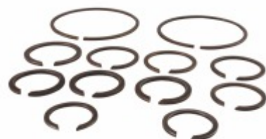
Kit Trava Caixa Câmbio FS-2305/240F/240V