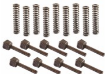
Jogo Pressionador Reparo Sincronizadores Caixa Câmbio ZF G60/85