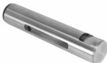
Pino Mola Sem Fresa (25x126mm)