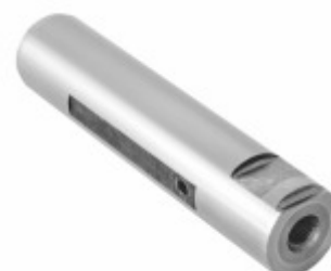
Pino Mola Com Fresa (25x117mm)