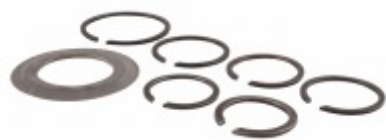
Kit Trava Caixa Câmbio EATON FSO4305/FSO4405