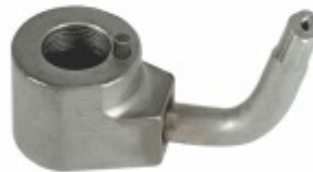
Bico Injetor de Óleo 2

Cód. Bradipar MB.10.0001.4 Cód. Original 427.180.00.43