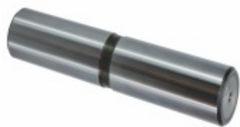
Pino da Balança 50 x 215 mm