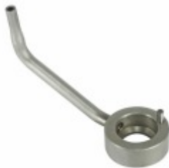
Bico Injetor de Óleo 4

Cód. Bradipar MB.10.0003.4 Cód. Original 457.180.14.43