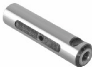
Pino Mola 110 mm