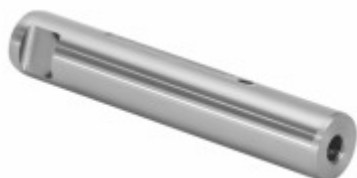
Pino Mola Sem Fresa (25x140mm)