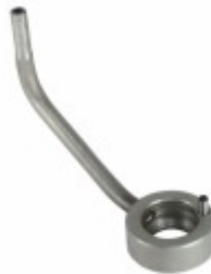
Bico Injetor de Óleo 5

Cód. Bradipar MB.10.0004.4 Cód. Original 460.180.00.43