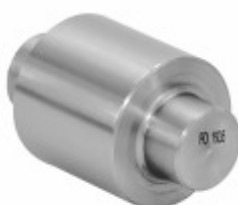
Rolete SAE 1020 Patim de Freio 18,86 x 32/35/38/41 mm