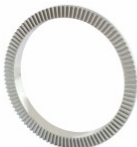
Anel do ABS 3013340315