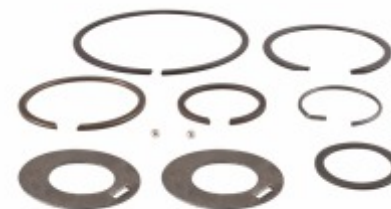
Kit Trava Caixa Câmbio Fs5005/5205