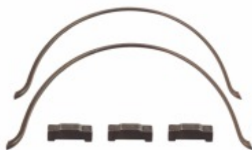
Kit Lamela Anel Sincronizado 1M, 2M FSO4305/FSO4405/FSO4505