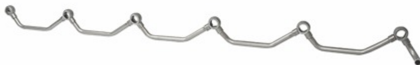
Conjunto Tubulação Intercooler