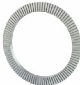
Anel do ABS 3073340115