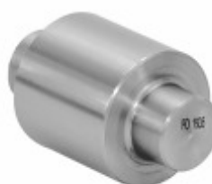
Rolete SAE 1045 Patim de Freio 18,86 x 32/35/38/41 mm