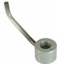
Bico Injetor de Óleo 6

Cód. Bradipar MB.10.0005.4 Cód. Original 460.180.04.43 460.180.08.43