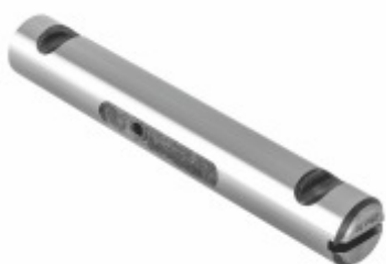
Pino Mola 170 mm