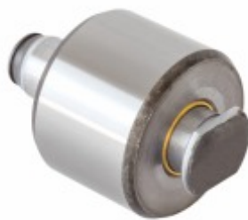
KIT Rolete c/ Bucha de Bronze Ø 23mm + Pino Sapata Freio