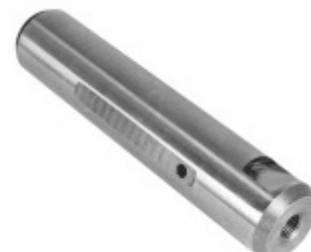
Pino Mola Sem Fresa (30x146mm)