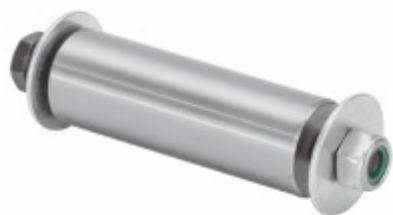
Kit Pino Sapata FR. (30x90 mm)