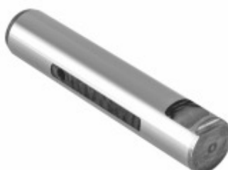
Pino Mola Com Fresa (25x126mm)