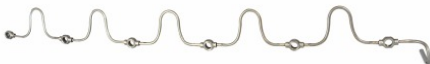
Cano Retorno Óleo Cabeçote Original