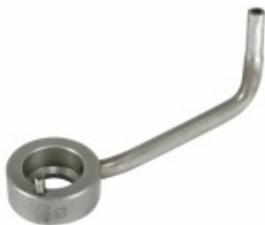
Bico Injetor de Óleo 7

Cód. Bradipar MB.10.0000.4 Cód. Original 407.180.06.84