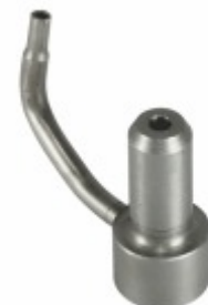
Bico Injetor de Óleo 11

Cód. Bradipar MB.10.0008.4 Cód. Original 906.180.05.43