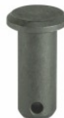
Pino Forquilha 14 x 40 mm